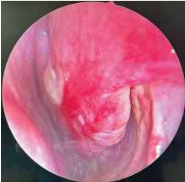
Рис. 1. Эндоназальная фотография левой половины полости носа в 1-й день обращения пациента

носа и заложенности уже ко второму дню применения назначенного лечения. Клинически состояние полости носа было оценено положительно: отмечено исчезновение гиперемии и отека слизистой оболочки при эндоскопическом исследовании, а также отсутствие отделяемого в полости носа (рис. 3). На контрольном исследовании с применением риноманометрии показатели носового дыхания приблизились к норме (рис. 4).