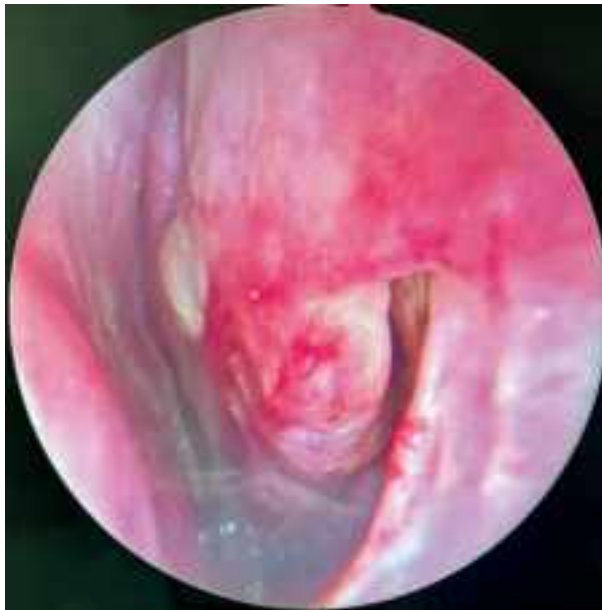
Рис. 3. Эндоназальная фотография левой половины полости носа на 3-й день от начала лечения: слизистая оболочка бледно-розового цвета, носовой ход широкий